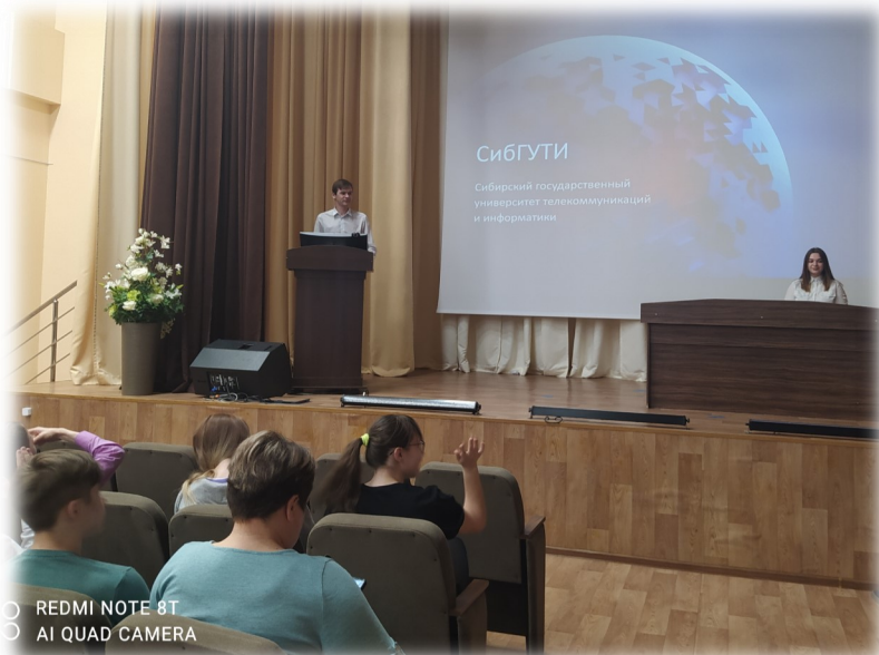
○ REDMI NOTE 8T ○ AI QUAD CAMERA

Так как профессиональная ориентация в целом это большая, комплексная система, включающая в себя множество аспектов и направлений, то можно выделить пять основных компонентов: экономический, медико-физиологический, педагогический, психологический и социальный. Социальный компонент – состоит в исследовании различной информации связанной с профессиями или рынком труда в целом: популярность, престижность, доходность, общественное мнение, степень удовлетворённости выбранной профессией. Также в социальном компоненте профориентации